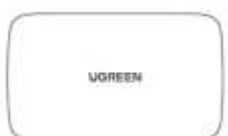
1 × HDMI Switcher 3 In 1 Out