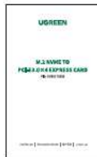
1 x User Manual